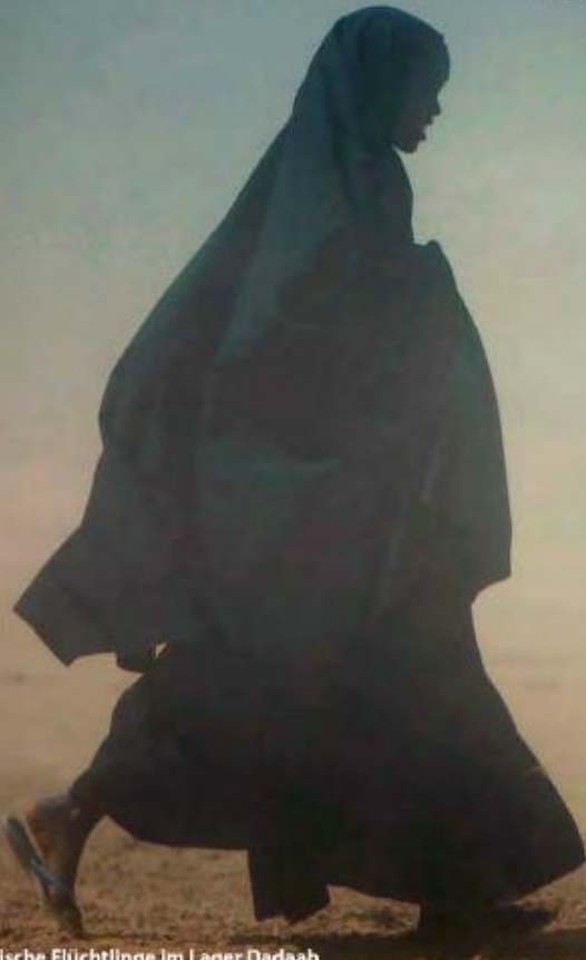
Somalische Flüchtlinge im Lager Dadaab

Informationsausstellung zum Thema Flucht, Flüchtlinge und Asyl